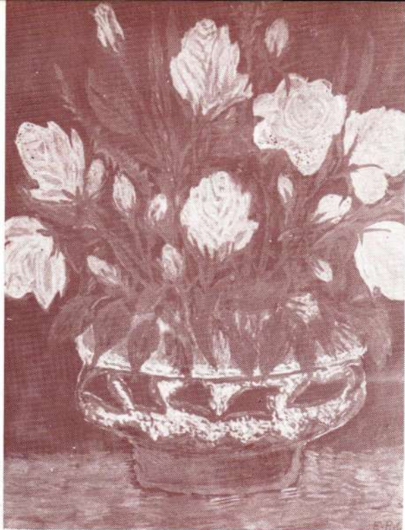
Elza Polak, Žute ruže , tempera, 1972.