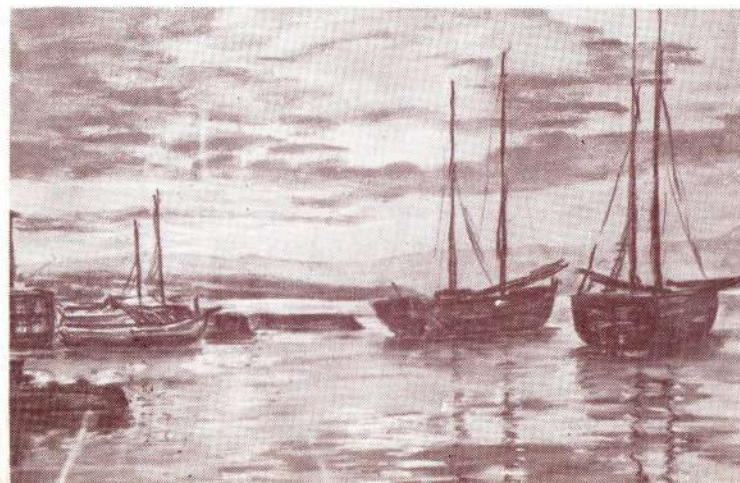
Ivan Berkeš, Veče u Malinskoj , pastel, 1976.