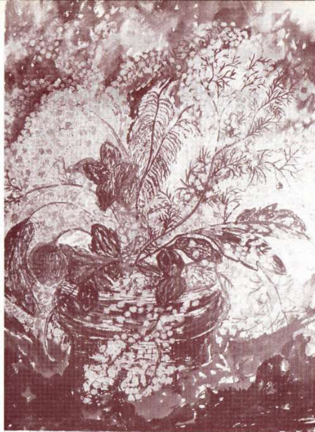
Jola Oberson, Mimoze , tempera, 1969.