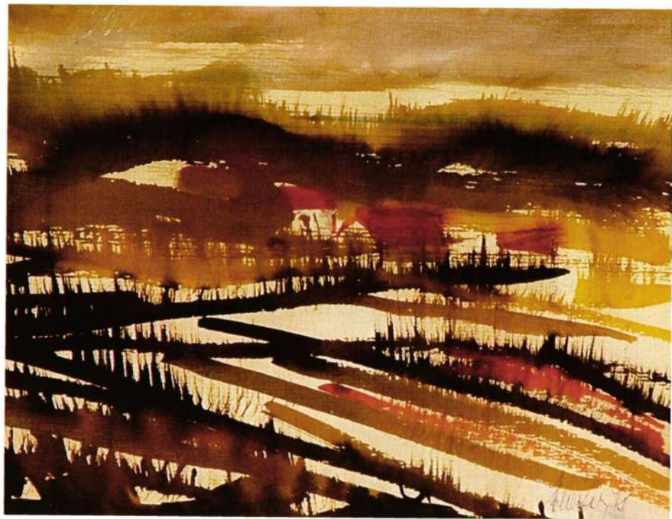
Poslednji sneg, 1975g.

Pitija me co nupivca p... u vojij Jul a naj... Korte ualuro o u fa Ome fut, fa p... so f... guarui p... ti u... vojri i f... na g... ra