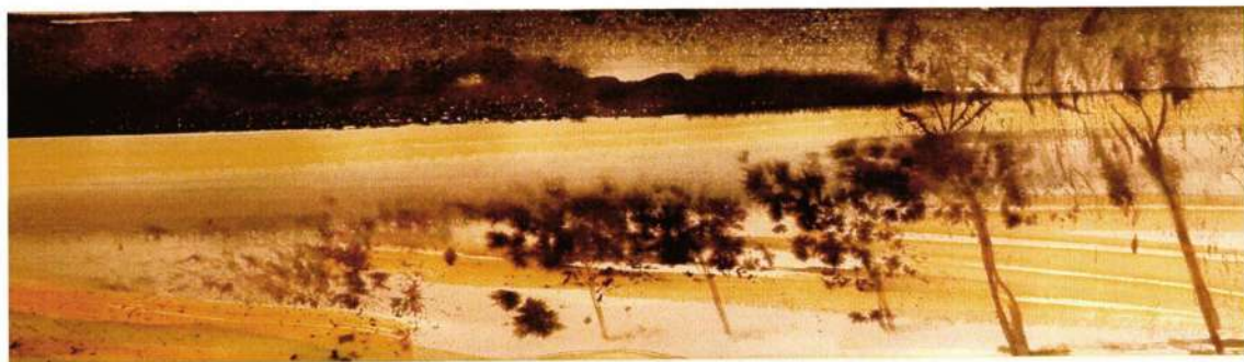
Smiraj, 1980 g.