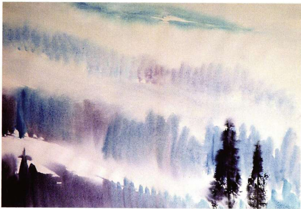
Magleni visovi, 1986g.

Pitaju me č uživo a p u onij u najh Korata u u pe Ane fu epuim bo fu Quar ti, me vaji i na qu