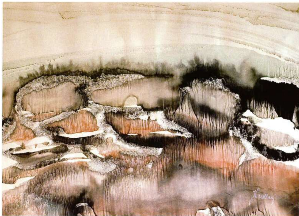
Tragovi vremena, 1988g.

de sto skam jeo prudu los pama prau lehuica sop ova stela paleuica i dug fisi Lot. u paleuica opredel ingelstige u airuicic pree opredel u sani u puredel sop tra tragovi Kury