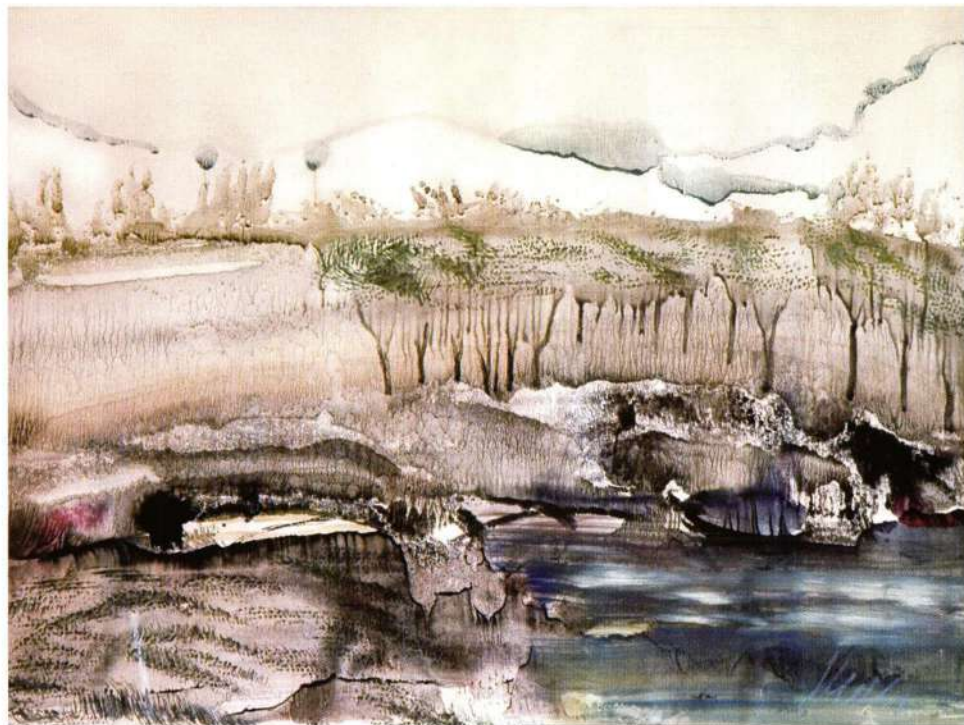
Na izvoru, 1988g.