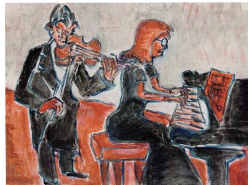
Sonata za klavir i violinu, tempera