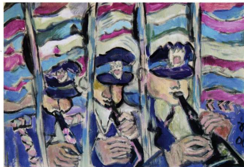
Pod zastavom, tempera