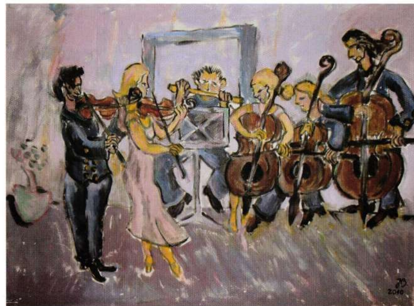
Mali orkestar I, ulje na platnu