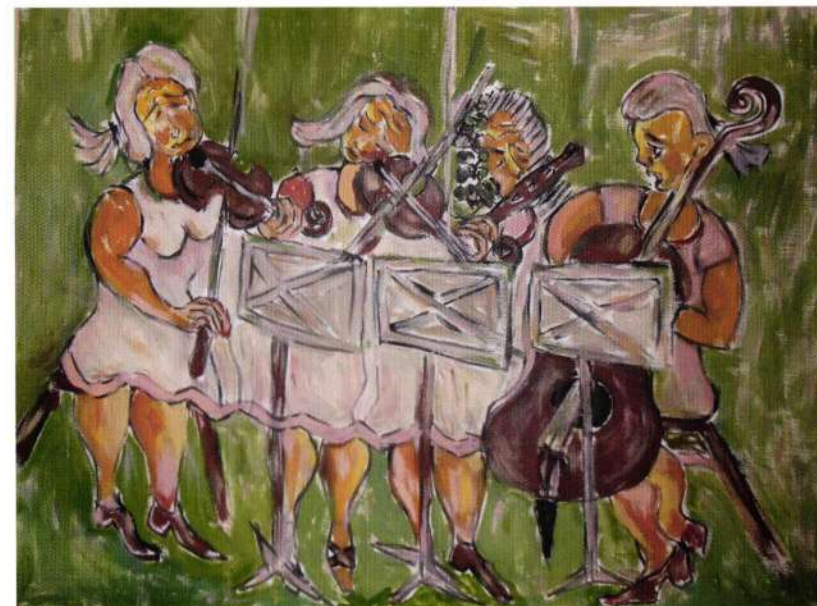
Kvartet I, ulje na platnu