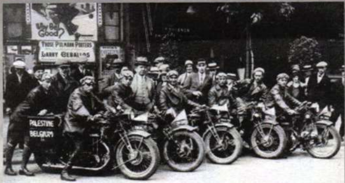
חלק מחברי המסלות של "מכבי" ארץ-ישראל על אופני מניע "סרולע" באנטוורפן (בלגיה) Part of the Palestine "Maccabi" delegation on "Sarolea" Motor-Cycles in Antwerp (Belgium)