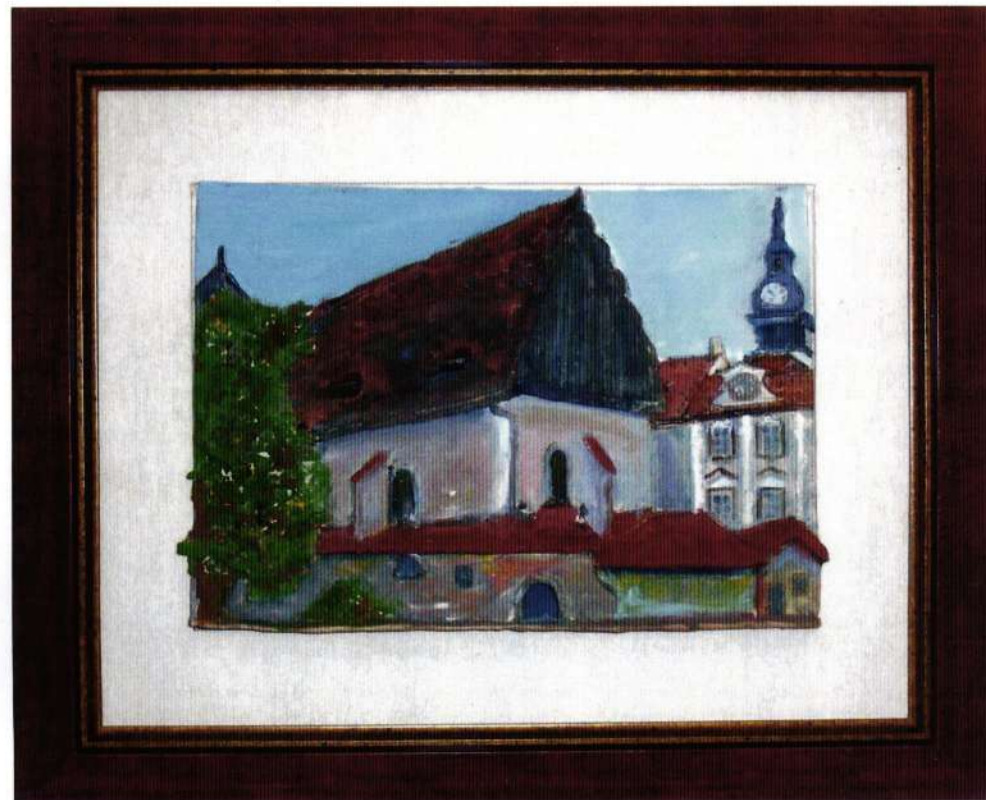
12. Sinagoga u Pragu, druga polovina 13. veka, (57x49)