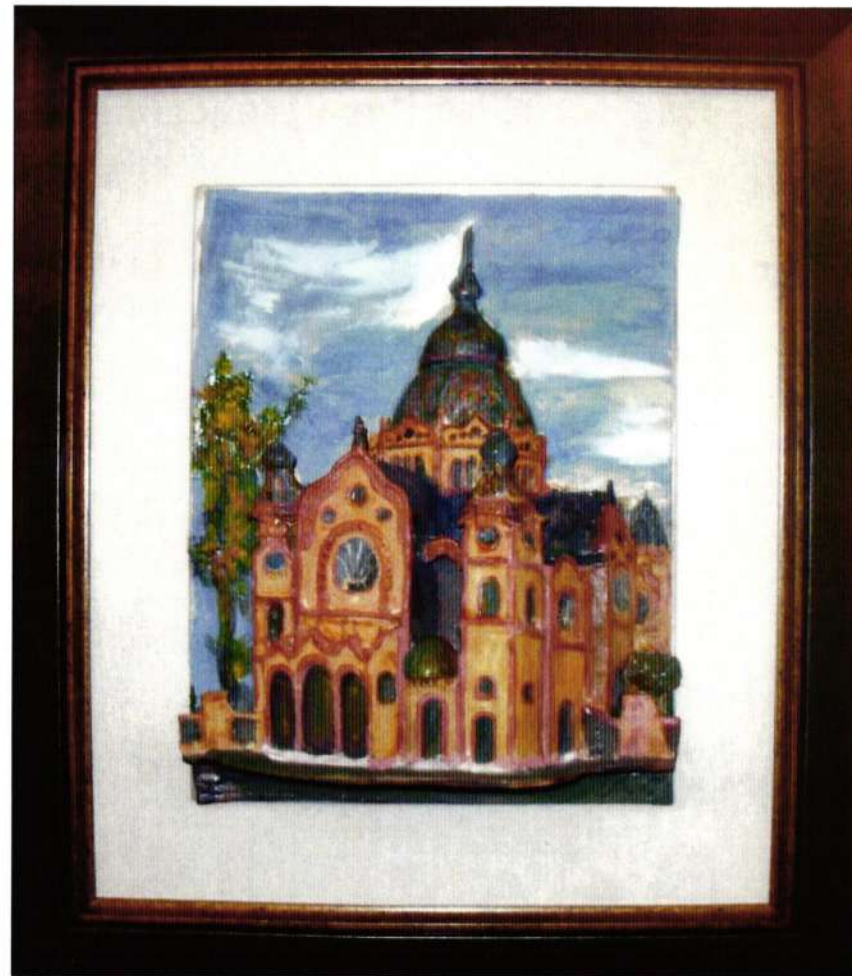
4. Sinagoga u Subotici, početak 20. veka, (57x49)

Emancipacija evropskih Jevreja je dovela do toga da su velike jevrejske zajednice polako izlazile iz svoje zatvorenosti, želeći da pokažu ne samo bogatstvo i raskoš svojih hramova, već i novostečeni građanski status. Sinagoge su građene u neostilovima karakterističnim za period istoricizma. Odlika modernih sinagoga 20. veka, pogotovo onih iz perioda nakon Drugog svetskog rata je jednostavnost, bez preteranog arhitektonskog i ornamentalnog ukrasa, a pre svega njihova funkcionalnost. Arhitektae su se našle pred novim zadatkom. Trebalo je uskladiti teološke potrebe sakralne građevine sa gotovo neograničenom stilskom slobodom umetnika, omogućenom upotrebom novih tehnologija gradnje. Potrebe savremenog društva su uslovile da sinagoga, pored osnovne funkcije kao mesto okupljanja i molitve, zauzme širu ulogu u životu moderne