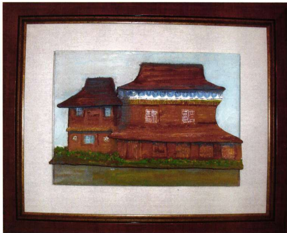
11. Drvena sinagoga u Zabłudovu (Poljska), sredina 17. veka, (57x49)