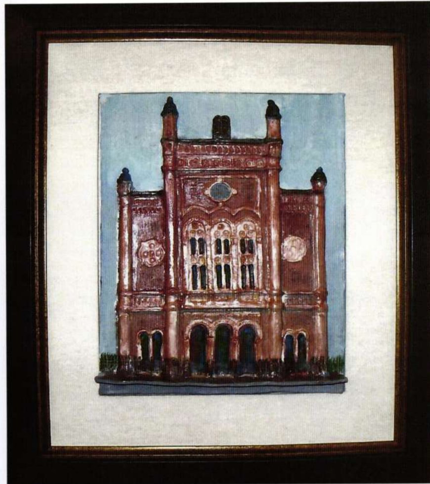
6. Sinagoga u Zagrebu, druga polovina 19. veka, (57x49)