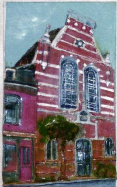
13. Sinagoga u Amsterdamu, kraj 19. veka, (57x49)

Najstarije sinagoge, nađene u Izraelu, a nastale do 4. veka, očitavaju jasan pravougaoni plan, jednostavnu unutrašnjost sa kamenim klupama i galerijama. Ulazna strana bila je okrenuta ka Jerusalimu. Za smeštaj kovčega sa svicima Tore , koji je u vreme ranih sinagoga još uvek bio pokretni objekat donošen na službu, zidani su aneksi. Neke od sinagoga su imale sa spoljne strane portik koji je služio kao mesto odmora tokom službe, ili kao konačište za putnike. U narednim vekovima, sinagoge su se gradile pod uticajem hrišćanskih crkava bazilikalnog plana. Ulaz je bio uglavnom na zapadnoj strani, dok je niša ili apsida sa mestom za Sveti ormar (hebr. aron hakodeš ) u koji su smeštani svici Tore , bila premeštena na istočnu stranu, u pravcu Jerusalima. Takođe su i vernici, koji su za vreme molitve bili u centralnom delu građevine odvojenom od ostatka prostora stubovima, bili okrenuti ka istoku. U istom prostoru, a između molitvenog dela i Svetog ormara, nalazila se uzdignuta platforma (hebr. bima ) sa koje se čitala Sefer Tora u vreme javnog bogoslužnja i pred kojom je stajao predvodnik sinagogalnog bogoslužnja (hebr. hazan ). Spoljašnje dekoracije nije bilo, dok je unutrašnjost ukrašavana mozaicima.