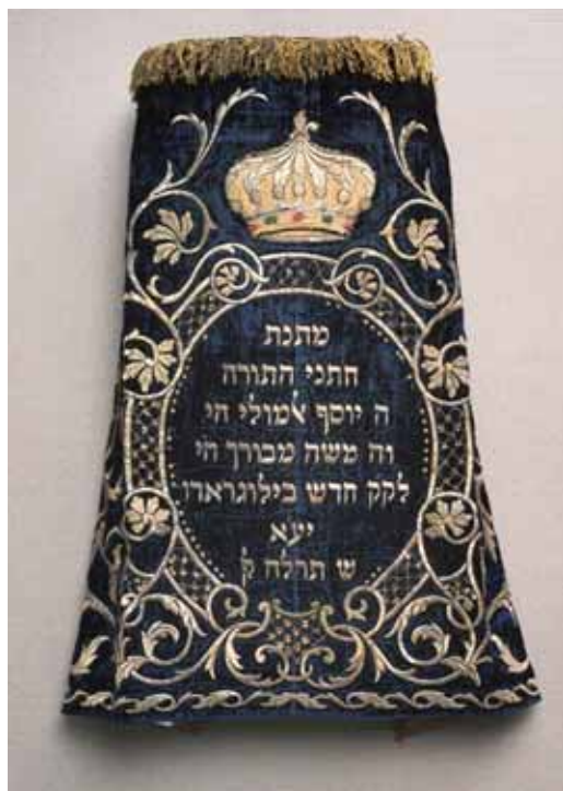
Везене тканине, детаљ

- Јевреји Дорћола – Прича о комшијама којих више нема , приређена је у Рексу, Београд, 1997., а гостовала је у Ерфурту, у Немачкој, 1998.;