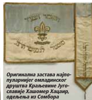
Оригинална застава најпопуларнијег омладинског друштва Краљевине Југославије Хашомер Хацаир, одељења из Сомбора

Омладинска радничка и студентска друштва, њихови скупови и заједничке активности, излети, радна камповања (хахшаре – обучавање у пољопривредним и занатским делатностима као припрема за одлазак у Израел, и боравак у тзв. мошавама – омладинским камповима).